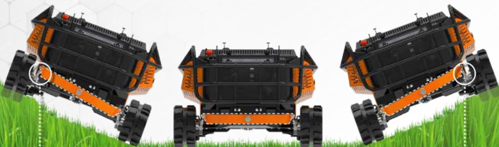
OSCILLAZIONE A SINISTRA LEFT SIDE OSCILLATION

RoboMINI grazie alla sua particolare concezione progettuale: baricentro basso e movimento oscillante dei cingoli, è perfetto per operare in zone sconnesse o su pendii ripidi, mantenendo sempre un ottimo grip in quanto la macchina resta sempre a contatto con la superficie anche in condizioni difficili.