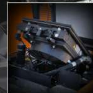
VENTOLA AUTOPULENTE IDRAULICA HYDRAULIC SELF-CLEANING FAN

RoboMINI è equipaggiato con una ventola autopulente idraulica, per migliorare produttività e risparmio di carburante.