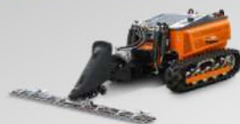
CUTTER BAR BARRA FALCIANTE CUTTER BAR

Barra leggera e maneggevole con 40 denti in carburo di tungsteno resistenti all'usura, ideale per tagliare alla base l'erba o il foraggio per permettere in seguito l'essiccazione e il successivo stoccaggio.