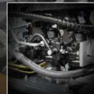
I MIGLIORI COMPONENTI THE BEST COMPONENTS