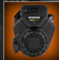
MOTORE A BENZINA DA 23 CV GASOLINE ENGINE 23 HP