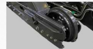
Tensionatore cingolo con molla di sicurezza Track tensioner with safety spring