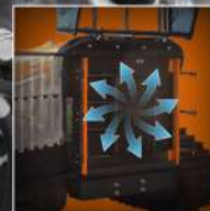
VENTOLA REVERSIBILE AUTOPULENTE FREXXAIRE® FREXXAIRE® SELF-CLEANING REVERSIBLE FAN

RoboMAX è equipaggiato con una ventola reversibile autopulente FLEXXAIRE®, per migliorare produttività e risparmio di carburante.