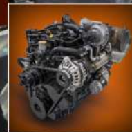
MOTORE YANMAR DA 75 CV YANMAR ENGINE 75 HP