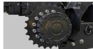
Ruota dentata cingolo in acciaio temperato Gear wheel of transmission to the tracks in hardened steel