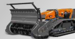
FORESTRY 150 H TESTATA FORESTALE A MAZZE GIREVOLI FORESTRY HEAD WITH SWINGING HAMMERS

Testata forestale costruita in Strenx®, robusta, affidabile ideale per il taglio di erba, arbusti e canne fino a 8 cm di diametro. Monta un rotore a mazze girevoli capace di triturare il materiale tagliato.