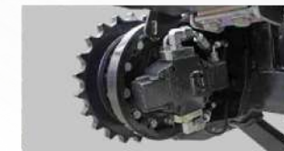
Riduttore con motore idraulico Hydraulic gearmotor