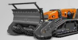
FORESTRY 150 T TESTATA FORESTALE A DENTI FISSI FORESTRY HEAD WITH FIXED TEETH

Testata forestale costruita in Strenx®, robusta, affidabile ideale per il taglio di arbusti o canne fino a 12 cm di diametro. Monta un rotore a denti fissi capace di triturare il materiale tagliato.