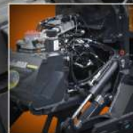
I MIGLIORI COMPONENTI THE BEST COMPONENTS